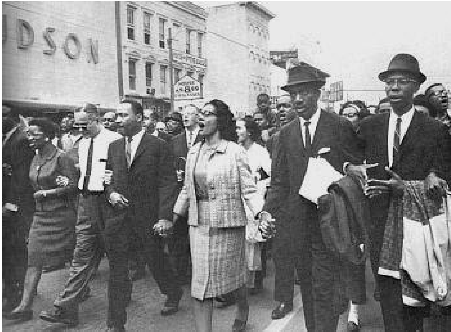
Martin Luther King con la moglie Coretta in una marcia a Montgomery in difesa di Rosa Parks, 1955-56