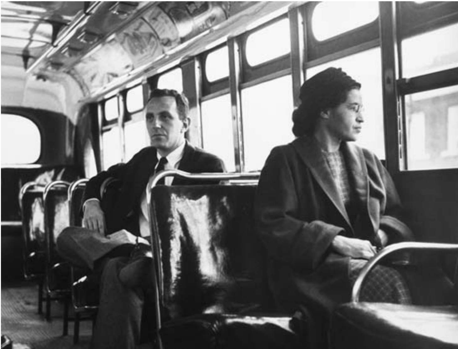
Rosa Parks nel bus Si tratta ovviamente di una ricostruzione, del 1956